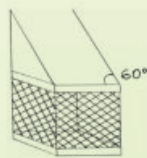
Figura 03. Modificação de superfícies de apoio para inclinações superiores a 60°.